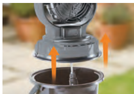
ポンプ バケツの水をポンプで給水