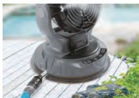
水道直結 水道からホースにつないで給水 ※水道直結時はミストスイッチは OFF