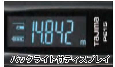
バックライト付ディスプレイ