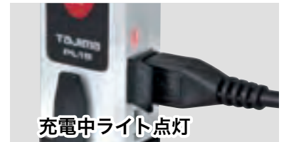
充電中ライト点灯