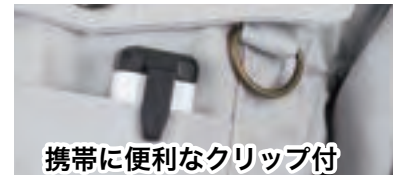
携帯に便利なクリップ付